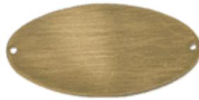
REF: P-12 Placa No Me Olvides