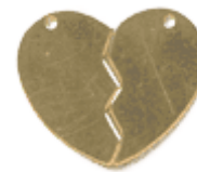
REF: CR-2 Colgante Corazón Partido