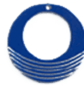
REF: Pendiente Pendiente plancha