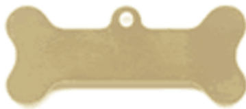
REF: PH-2 Colgante Pieza Hueso