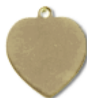
REF: CO Colgante Corazón Entero