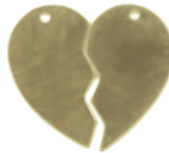
REF: CR-1 Colgante Corazón Partido