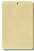
REF: PC-1 Colgante Placa 24 x 36 x 1,2

DIMENSIONES : Anchura x Altura x Grosor (en mm.)