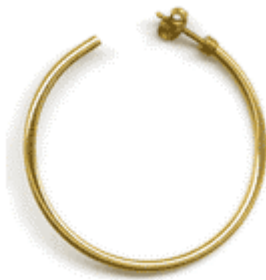
REF: Criollas Criollas

DIMENSIONES : Diámetro exterior x Diámetro alambre (en mm.)