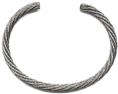
REF: Trenzada Pulsera Cordón Trenzado