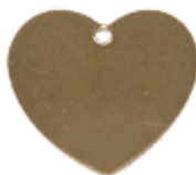
REF: CR-3 Colgante Corazón Entero