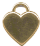
REF: CO nº2 Colgante Corazón nº2