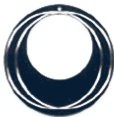
REF: Pendiente Pendiente plancha