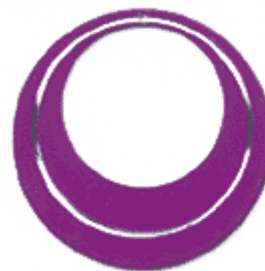
REF: Pendiente Pendiente plancha