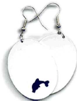
REF: Pendiente Pendiente oval