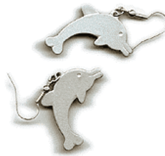
REF: Pendiente Pendiente pez