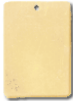
REF: PC-4 Colgante Placa 22 x 30 x 1,2